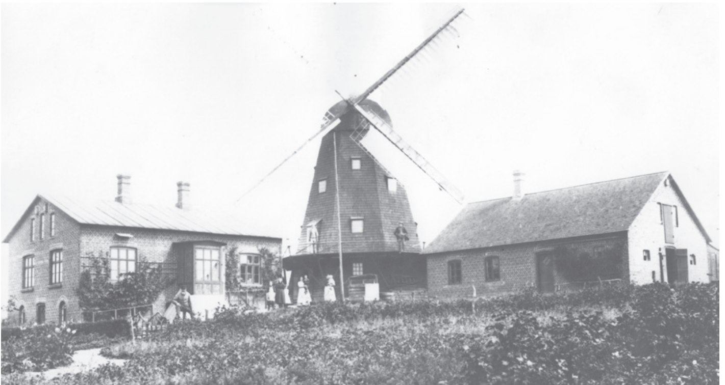
Ry Ny Mølle, Møllevej 7, Ry. 1910. Møllen ses midt i billedet med de to længer ved hver side. Billedet er taget fra Bodalsvej nær baneterrænet. Foran bygningerne ses mindst 8 personer: mølleren, nogle børn, to kvinder med småbørn og på gangen rundt om møllen står møllersvenden.

Vejen er endnu en jordvej. Maleriet tilhører Skanderborg Kommune