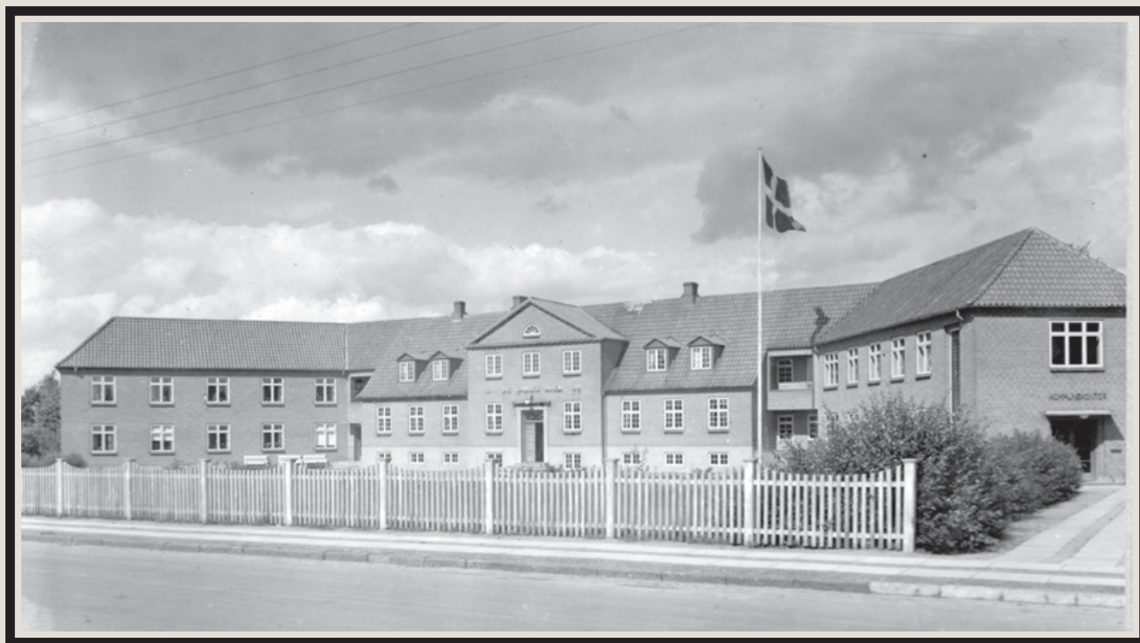
De gamles Hjem i Ry