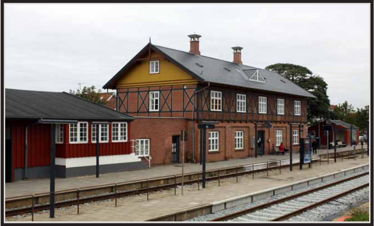
"RY STATION 2012"