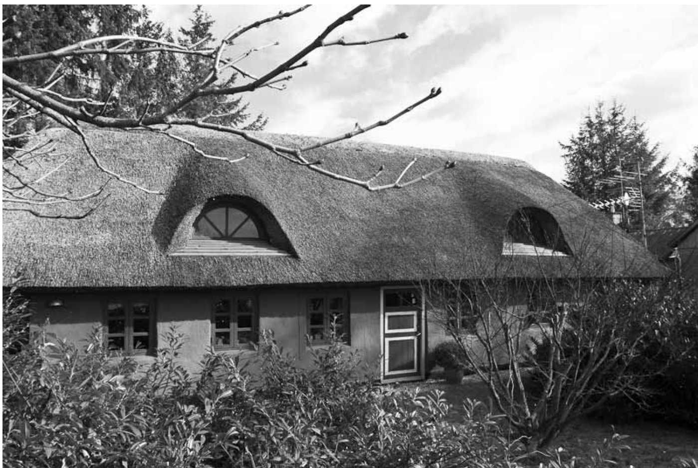
”Siim gl. skole, Siim Bygade 123, 2010”