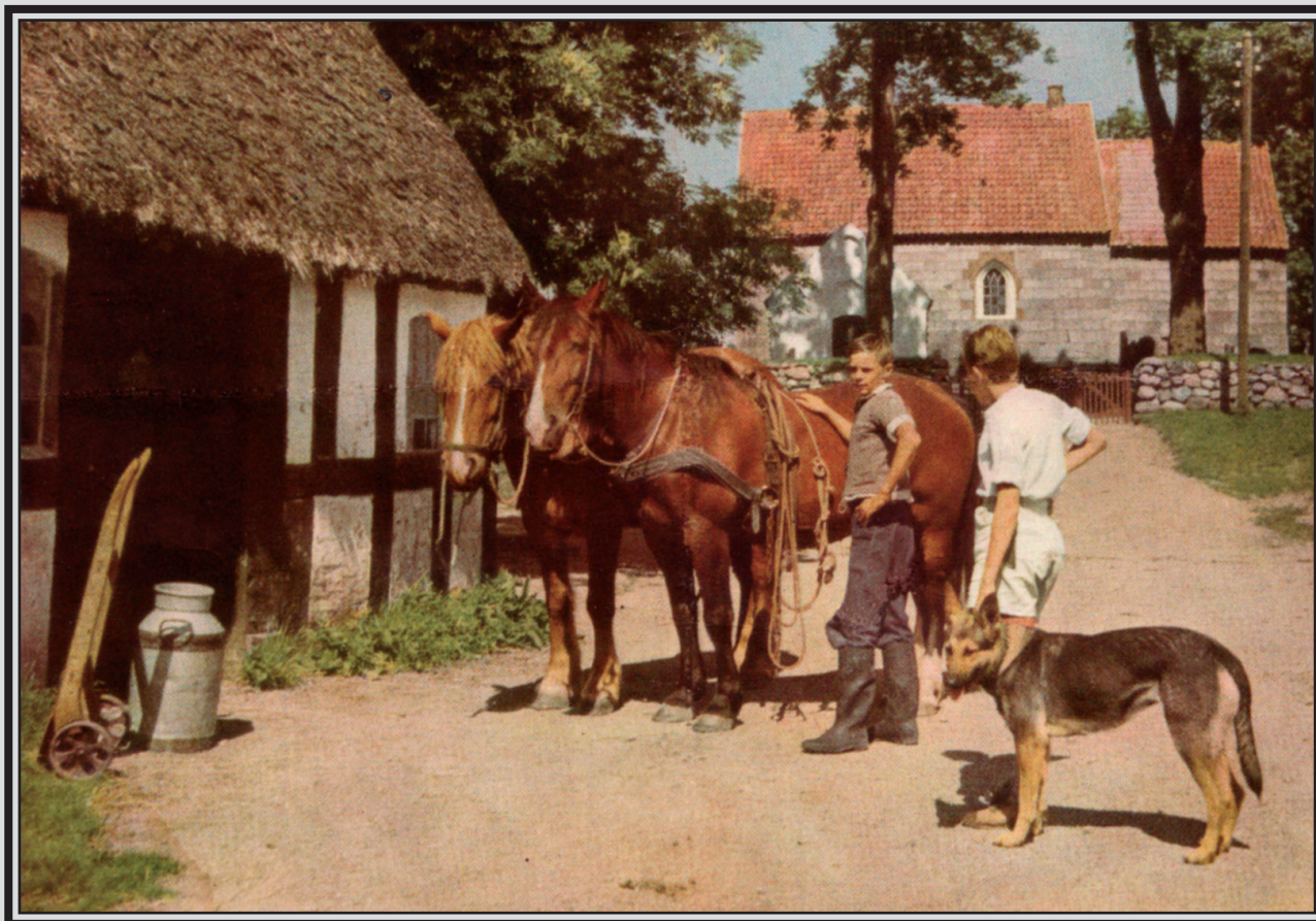
Ved Alling Præstegård 1952