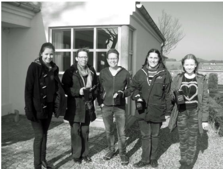
Fra Sogneindsamlingen 2014