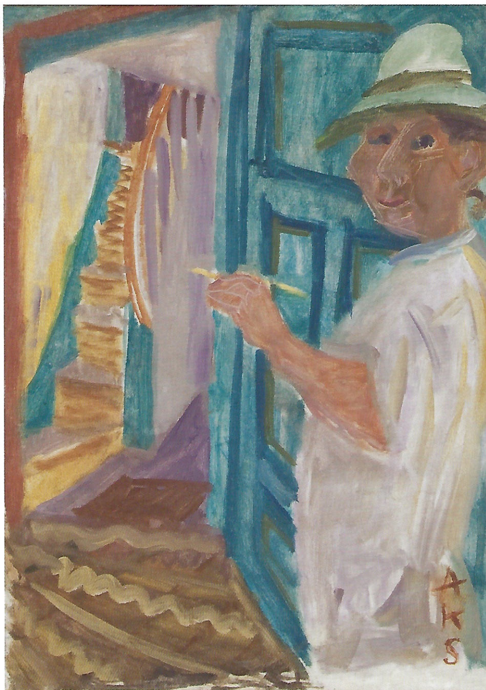
Malerindeportræt/Selvportræt. 1942. Olie på lærred. 64 x 47 cm.